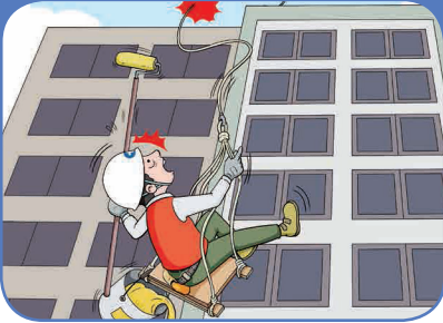
로프 고정장치 파손